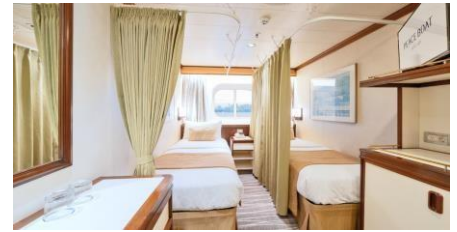
同行共享海景艙房 (Cat. F2/E2)

Size 面積: 33 m 2 Including Balcony 連露台 Deck 樓層: 10