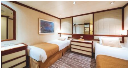
內艙房 Inside Cabin (Cat. G/M)

同行共享內艙 Semi-Single Inside (w curtain) (Cat. G2)