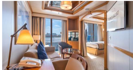
迷你套房 Junior Suite (Cat. B)

Size 面積: 14 m 2 (F/E/L/K/D2) / 16 m 2 (D1) Deck 樓層: 5-6 (F/L), 8 (E/K), 8 (D2), 9-11 (D1)