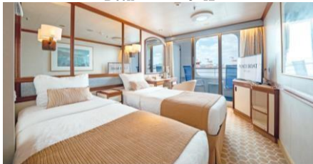
露台艙房 Balcony Cabin (Cat. C1/C2/I/J)

Size 面積: 17 m 2 Including Balcony 連露台 Deck 樓層: 9 (C2/I/J), 10-12 (C1/I)