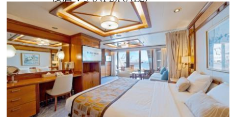
Premium Suite 尊爵套房 (Cat. A3)

Size 面積: 14 m 2 Deck 樓層: 5-6 (F2), 8 (E2)