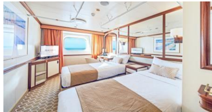
海景艙房 Outside Cabin (Cat. F/E/L/K/D2/D1)

Size 面積: 17 m 2 Including Balcony 連露台 Deck 樓層: 9 (C2/I/J), 10-12 (C1/I)